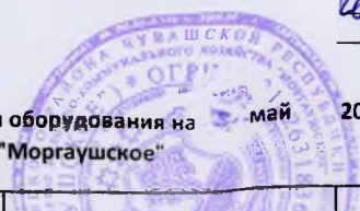
График ремонта ЛЭП, ПС и оборудования на май 2017 года по МУП ЖКХ "Моргаушское"